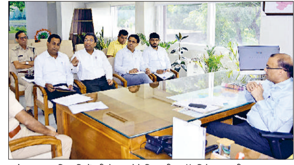
फतेहाबाद। अधिकारियों की बैठक लेते जिलाधीश डॉ. विवेक भारती।

■ चिन्हित अपराध मामलों की समीक्षा बैठक, डीसी ने जरूरी दिशा निर्देश जारी किए