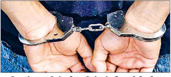
पुलिस ने अपराधियों की संपत्तियों को सीआरपीसी की धारा 82 व 83 के तहत विधि अनुसार अटैच कुर्क किया है।