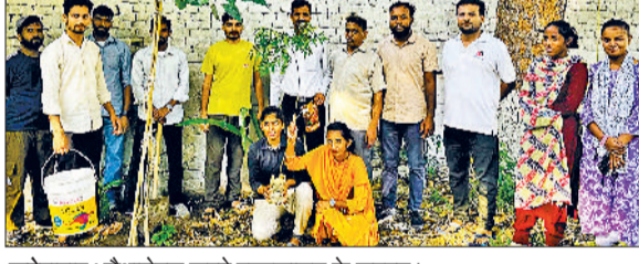
फतेहाबाद। पौधरोपण करते पुरस्कृत कालय के सदस्य।