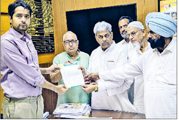
सिरसा। डीसी को ज्ञापन सौंपते जेजेपी नेता।