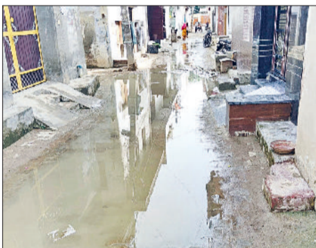
सिरसा। सीवरेज ओवरफ्लो से गली में बहता दूषित पानी।