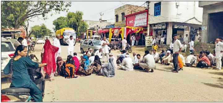
भटूकलां। खाद को लेकर रोड जाम करते किसान।