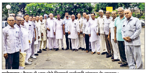
फतेहाबाद। बैठक में भाग लेते रिटायर्ड कर्मचारी संगठन के सदस्य।