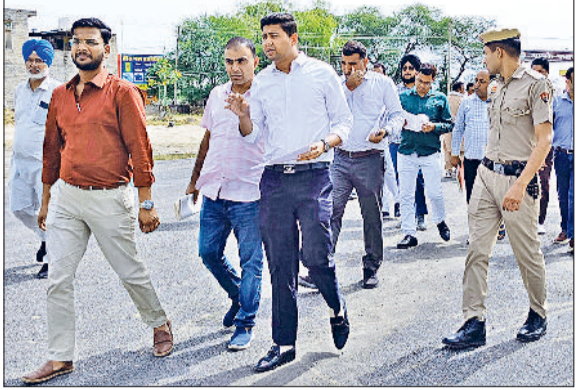
सिरसा। अतिरिक्त अनाज मंडी का निरीक्षण करते हुए एसडीएम।