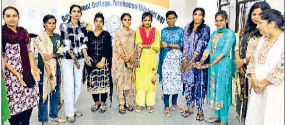
फतेहाबाद। राजकीय कॉलेज में आयोजित विभिन्न प्रतियोगिताओं में भाग लेते विद्यार्थी।