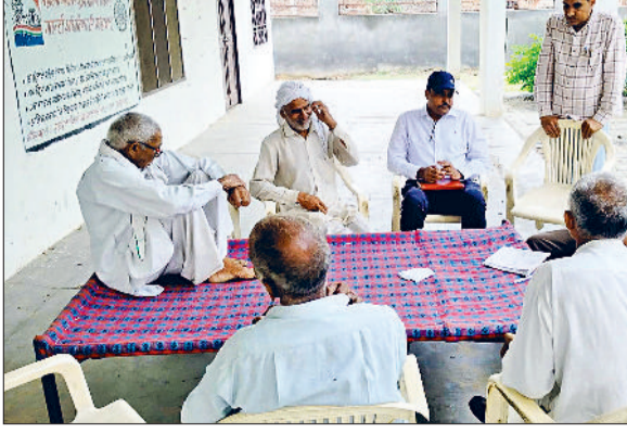
घर जाकर डोर टू डोर सर्वे किया। टीम ने क्षेत्र में नशे से प्रभावित 8 इग पीड़ितों की पहचान कर उनके डोजियर तैयार किए तथा सभी को काउंसलिंग के बाद आयुर्वेदिक एवं

पुलिस अधीक्षक सिद्धांत जैन के मार्गदर्शन में जिलेभर में चल रहे नशा मुक्ति एवं जागरूकता अभियान के तहत गांवों में सभाओं का आयोजन किया गया। समाज के लिए खतरा एसआई सुंदर के नेतृत्व में नशा मुक्ति टीम ने गांव माधुआना में घर-