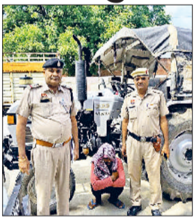
फतेहाबाद। पुलिस गिरफ्त में धोखाधड़ी का आरोपी।